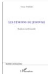
PERREC, Vivien Les Témoins de Jéhovah. Analyse psychosociale HARMATTAN, 2012 202 págs.

El 25% de las consultas recibidas por la Miviludes están relacionadas con el ámbito de la salud. Por este motivo se ha publicado esta guía que facilitará la evaluación de las situaciones de riesgo de derivas sectarias en este campo.