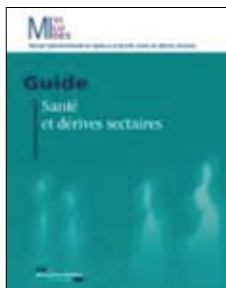
Guide «Santé et dérives sectaires» PARIS, MIVILUDES, 2012 201 págs.

El 25% de las consultas recibidas por la Miviludes están relacionadas con el ámbito de la salud. Por este motivo se ha publicado esta guía que facilitará la evaluación de las situaciones de riesgo de derivas sectarias en este campo.